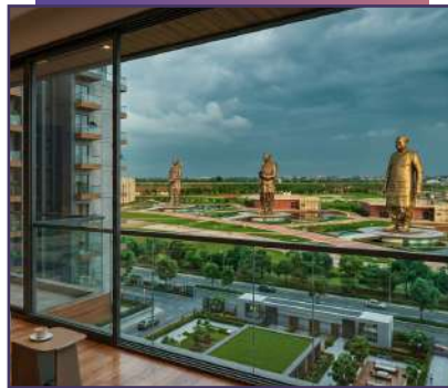
Rashtra Prerna Sthal