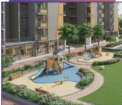
Kids Play Area